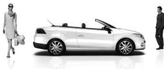
Prix de vente nets recommandés, TVA 8,0% incluse