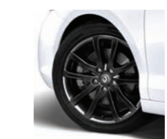
CERCHI 18" INTERLAGOS CHROME SHADOW (di serie su Laguna Coupé Monaco GP)